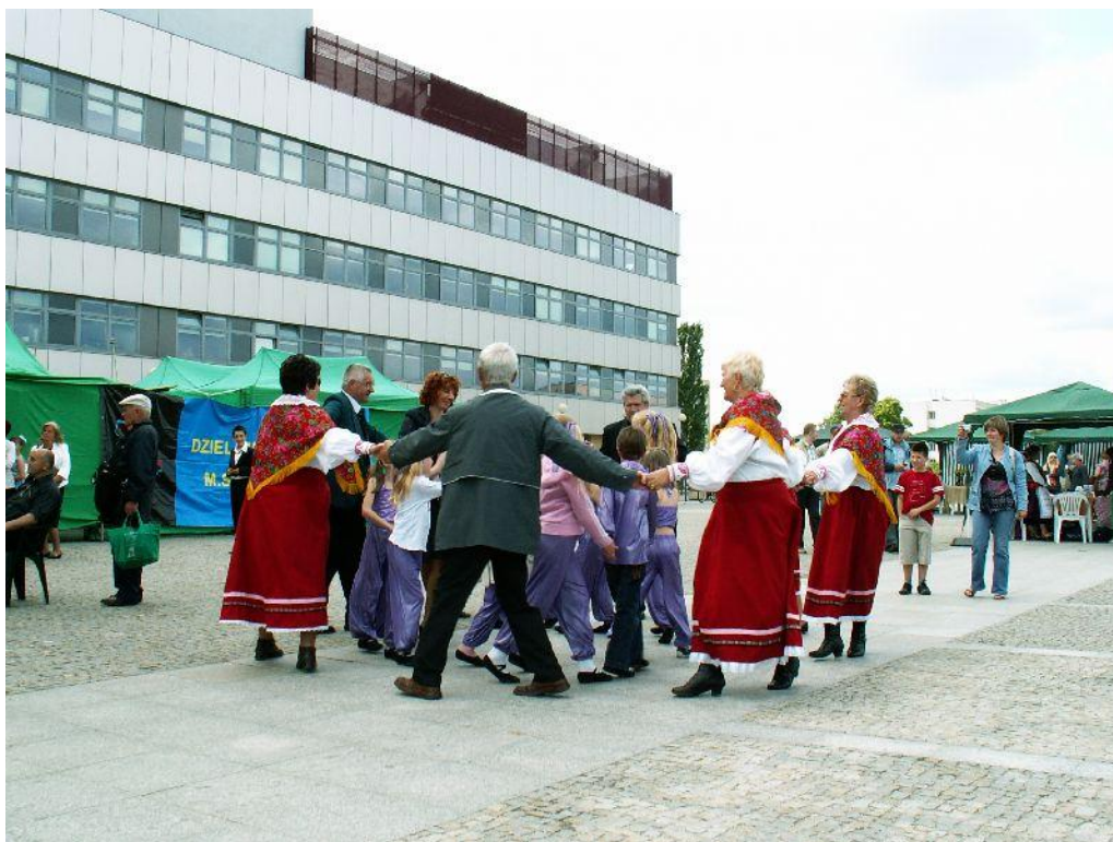
Zabawa podczas występu SADOWIANEK

Komentarz zamieszczony w Internecie na temat występów brzmiał:- „Ależ się działo- Publiczność szalala. Wreszcie wszystkich do tańca zachęciły Sadowianki z Sadownego w powiecie węgrowskim. I rzeczywiście podczas ich występu publiczność śpiewała, tańczyła i wspaniale bawiła się.”