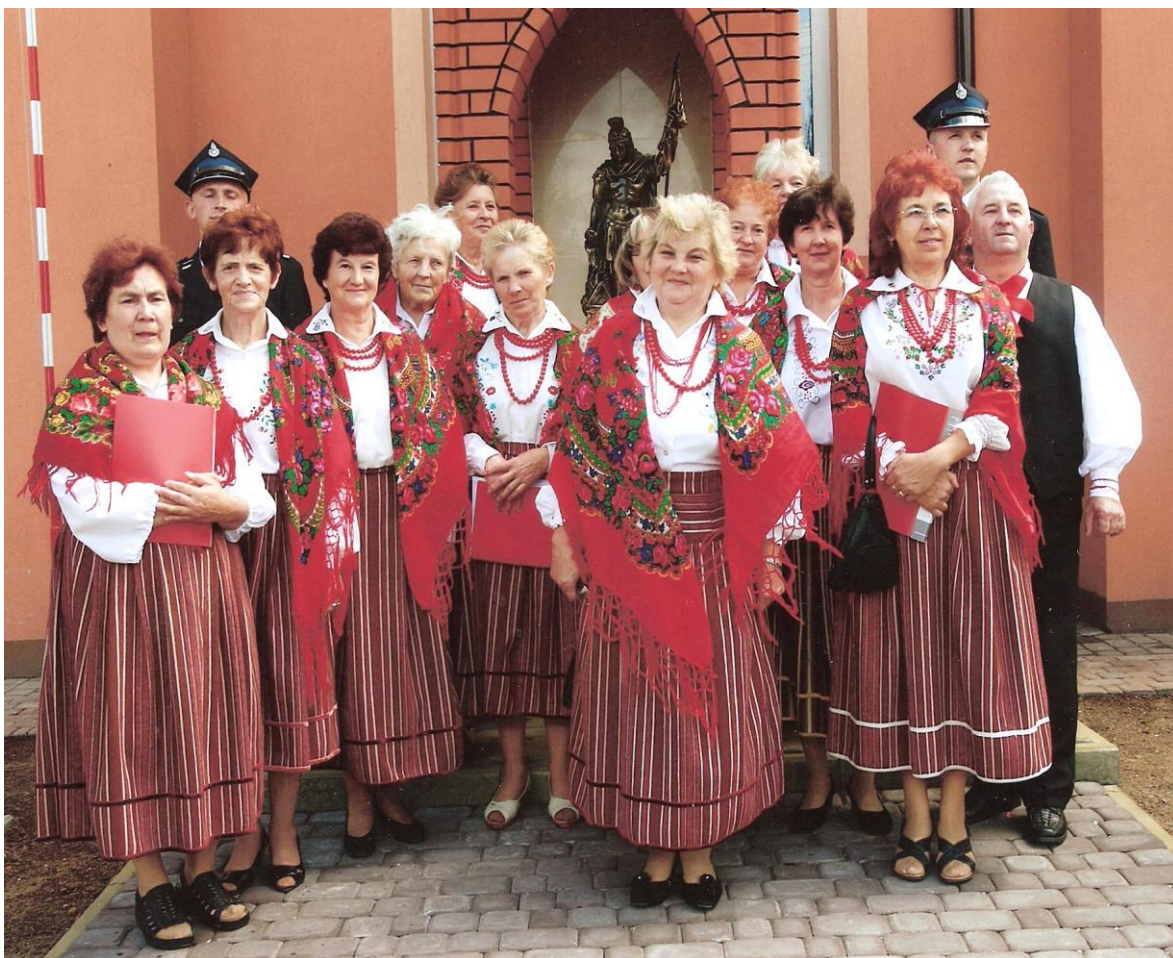
SADOWIANKI przed figurką św. Floriana w Sadownem.