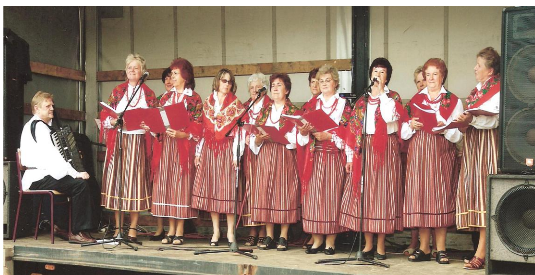
Na scenie w repertuarze strażackim.