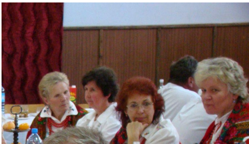
Poczęstunek w Sali OSP