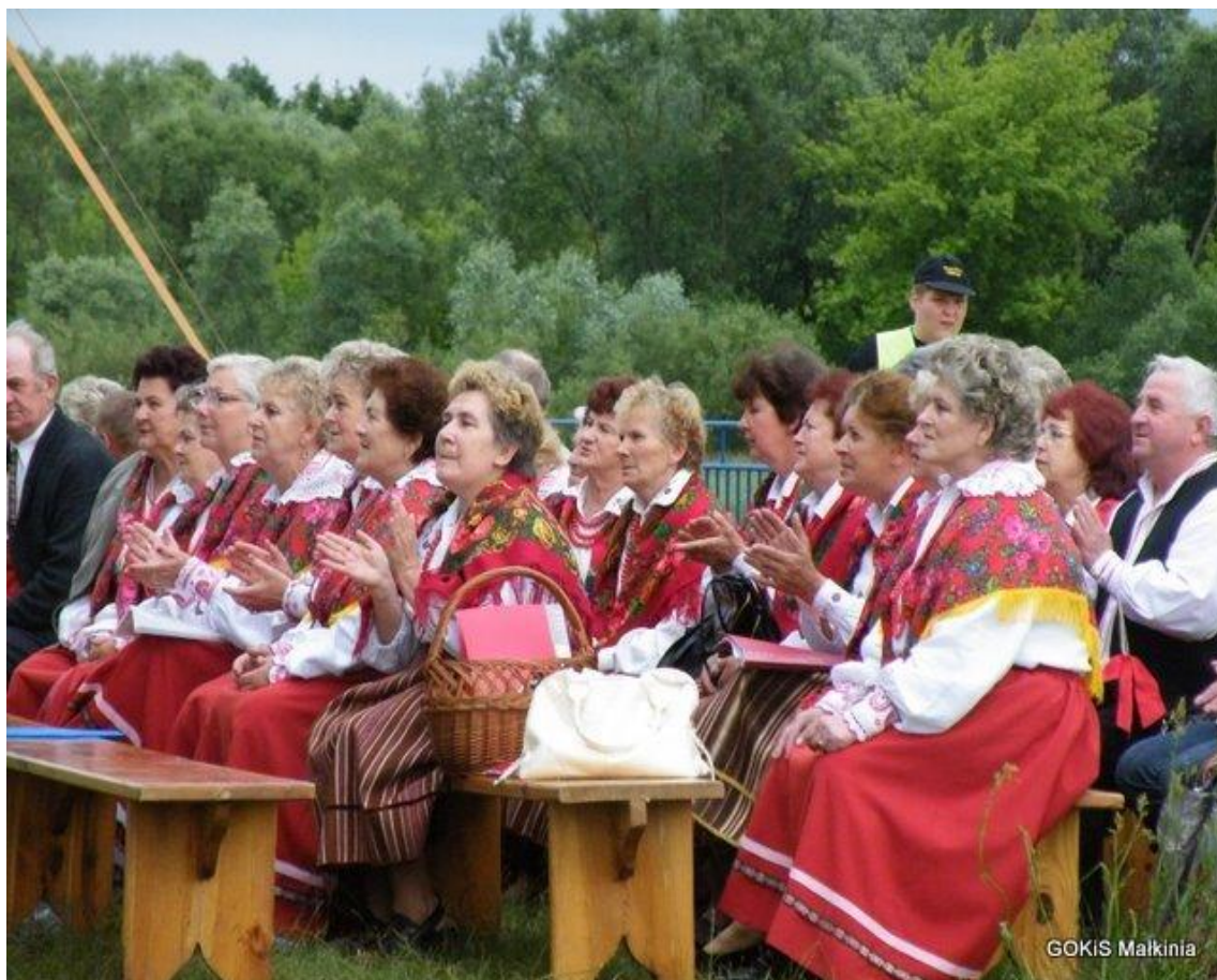
Widownia: Zespoły SADOWIANKI i MAŁKINIANKA.