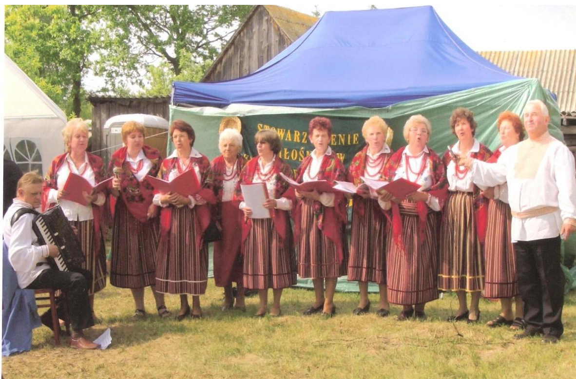
SADOWIANKI – w „Kozim Grodzie” – Prostyń

W zagrodce pasły się kozy a to właśnie te zwierzęta identyfikowane są z Prostynią.