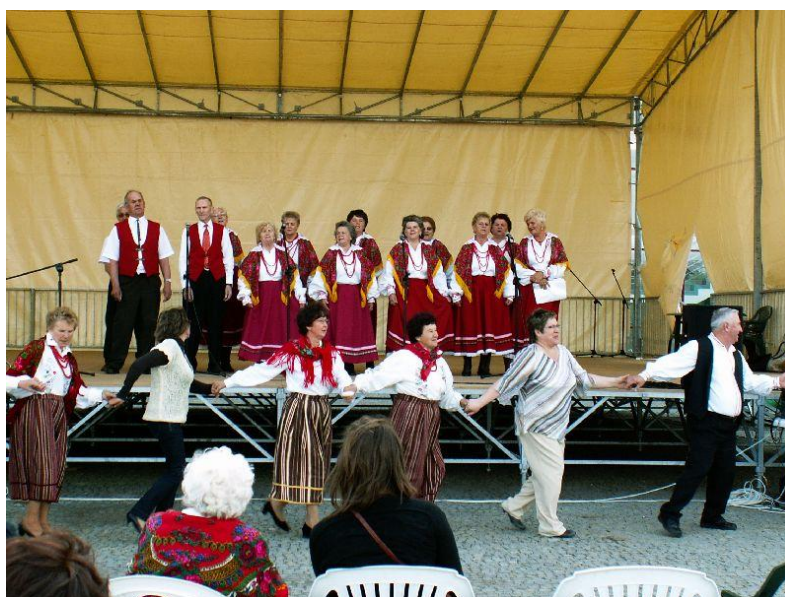
SADOWIANKI tańczą podczas występu zespołu Małkinianka.