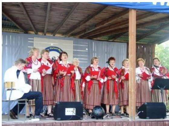
Kielczew-„Dzień Radości Wakacyjnej”