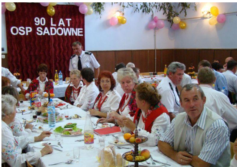
Poczęstunek w Sali OSP